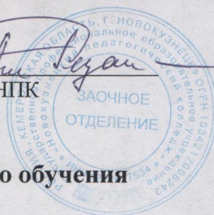
График учебного процесса на отделении заочного обучения I семестр 2017 – 2018 уч. год